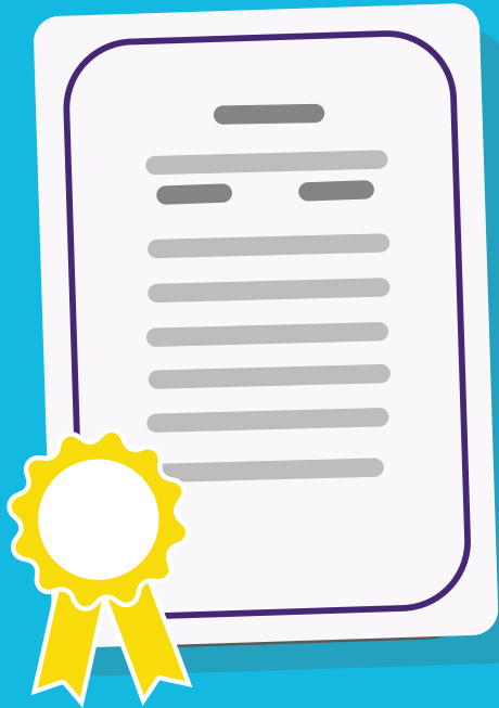
Certificado de Estudios