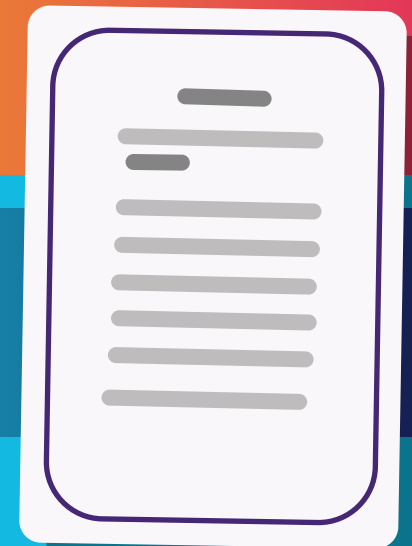
Duplicado de Certificado